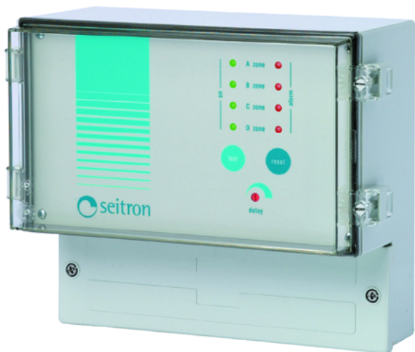
Рис.1 Внешний вид