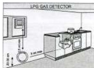
Установка датчиков FLY на L.P.G.