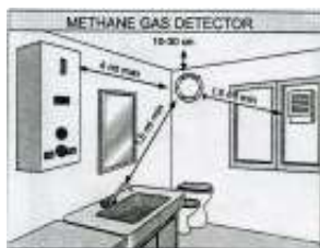
Установка датчиков FLY на метан